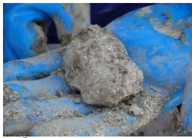
將「止水砂漿」用水拌合捏成乾土球團狀