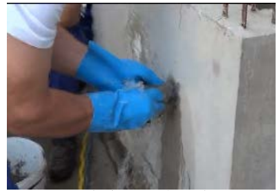
用力塞入漏水孔中