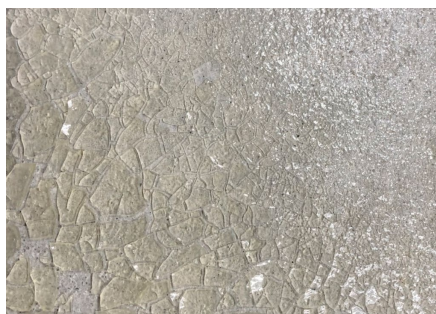
浸淹後固化的矽膠晶體