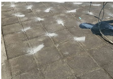
頂樓平台地坪以棋盤式灌注止漏