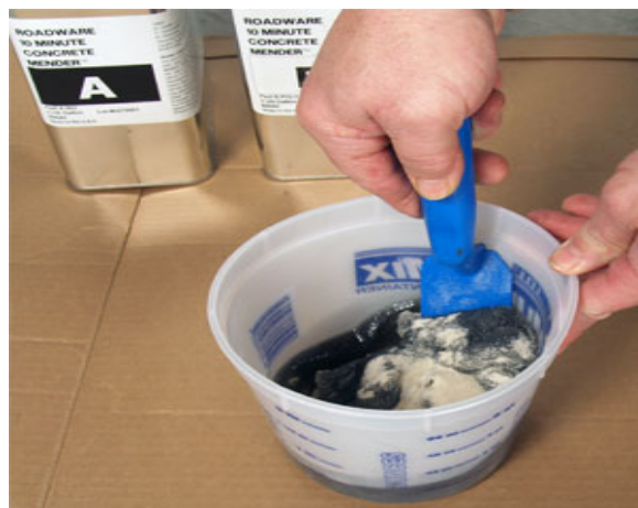
用手攪拌均勻。為取得最佳的稠度，可再添加矽砂，但最多只能添加原用量的 1/2。