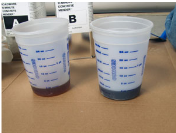
A、B 劑的比例為 1：1，勿更改此比例。