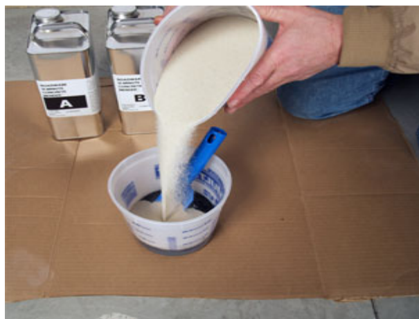
倒入矽砂，其用量為 A、B 劑合計的 2 倍。