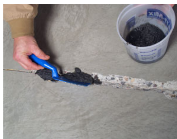
將拌勻的縫寶快速塗佈於修補區。拌勻的材料需於 5 分鐘內或更短時間內使用，其視拌料多寡與溫度而定。