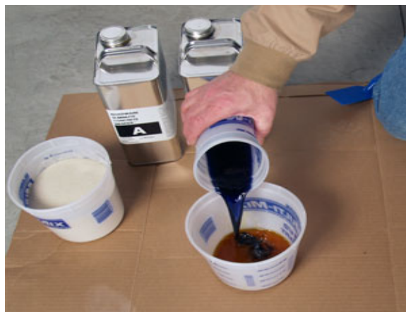
將 A、B 兩劑分別倒入大拌合空桶中，並用手拌或電動攪拌器慢速攪拌 10 秒。