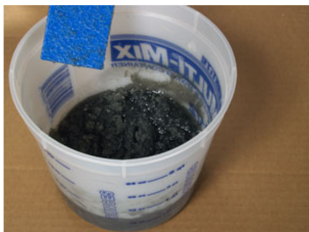
輕敲拌合桶的側邊，以觀察其稠度。如上層表面看似呈潮濕狀，即為適當的稠度。